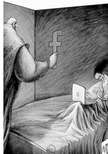
EN REDES. Conectados.