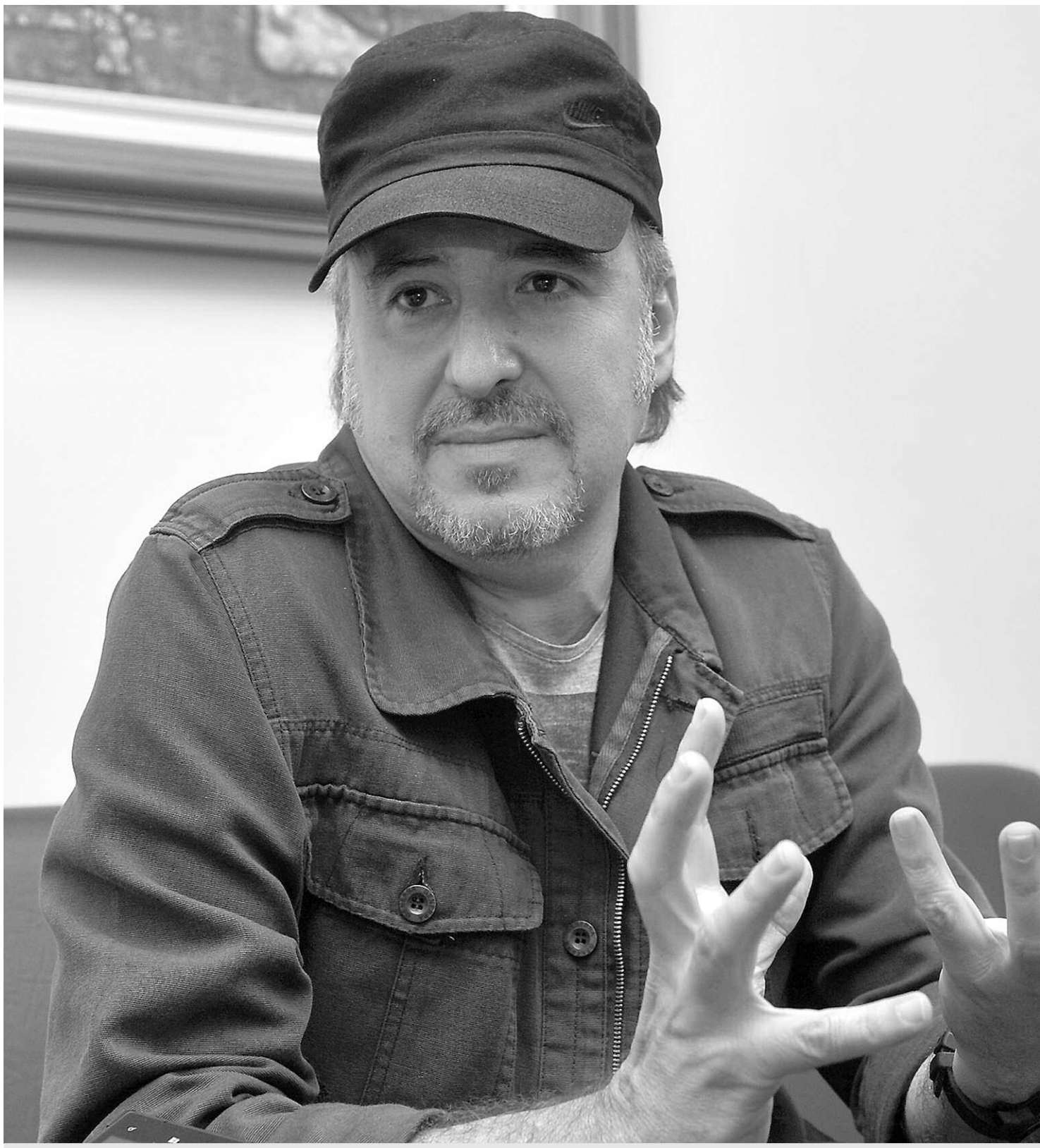
VISITA. Ángel Boligán estuvo en nuestra ciudad para contar su experiencia en su profesión como caricaturista.

Boligán Corbo opina que este tipo de concursos sirven para conocer la realidad de otras naciones. “Y nos damos cuenta que al otro lado del mundo se presentan los mismos problemas. Considera que a través de estos concursos que tienen temas relacionados con la problemática social ayudan mucho porque se realiza una especie de denuncia”, indicó, agregando que ese es precisamente el trabajo que realiza en El Universal , el que le da un generoso espacio para que publique caricaturas sobre