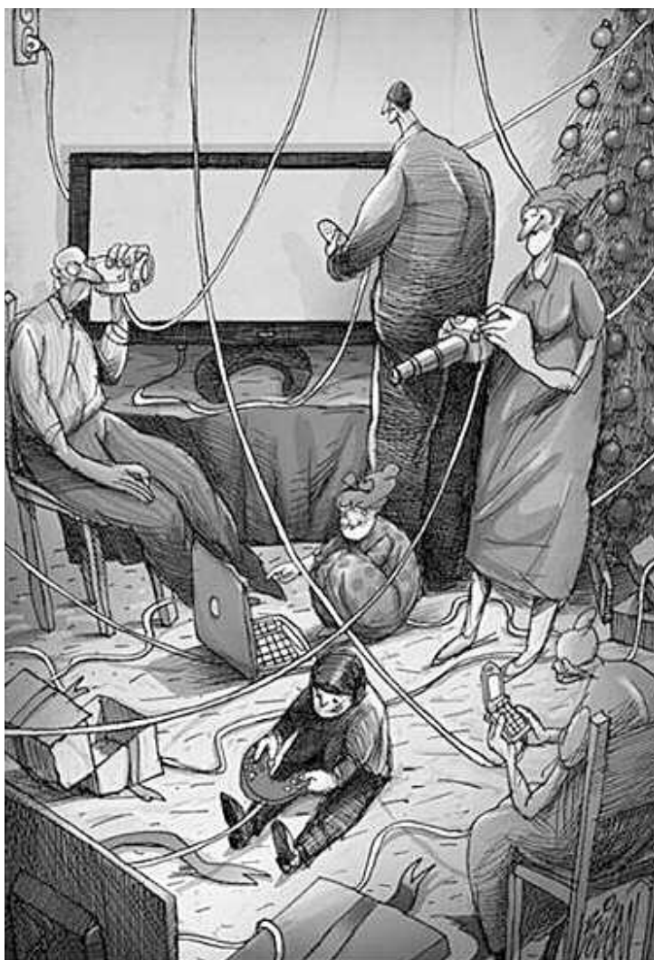
EN LA ERA DIGITAL. Presenta realidad de familias de hoy.